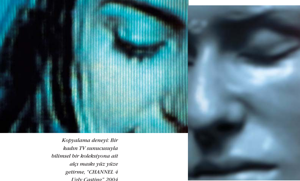
Kopyalama deneyi: Bir kadın TV sunucusuyla bilimsel bir koleksiyona ait alçı maskı yüz yüze getirme, "CHANNEL 4 Ugly Casting" 2004

me alanlarında da boy göstermeye başladılar. Bu yeni eğilime Berlin'de yaşayan sanatçı Gabriele Leidloff iyi bir örnektir. Sanatçı, nörolojik sorunlara yönelik incelemeleri sanatının konusu yapıyor. Leidloff'un bugüne kadar sanat icra ettiği dallara bakıldığında disiplinler arası çalışmaya ne kadar hazır olduğu da görülebilir. Çok yönlü yetenekleriyle dikkat çeken sanatçı güzel sanatlardaki çalışmalarının yanı sıra drama yazarlığı, oyunculuk ve üniversite hocalığı gibi birbirleriyle keşilebilen pek çok sıfatı da taşımaktadır. Bu farklı farklı faaliyet alanlarından elde ettiği deneyimler, sanatbilimsel çalışmalarının da -Leidloff'un, "sanatbilimsel" kavramını klasik anlamda bir sanat türü