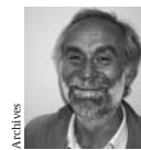
DR. EUGEN BLUME Sanat uzmanı Blume, Berlin'deki Hamburger Babnhof Ulusal Galerisi Çağdaş Sanat Müzesi yöneticisi

hali niteliğinde objeler olan ve yalın materyallikleri bile ikinci bir anlam düzlemi ele veren ölü masklarını ya da vitrin mankenlerini de sanatında işliyor. Leidloff kendini sanat ve bilimin sınırlarında gezinen biri olarak değil, sanatı bilim olarak icra eden bir sanatçı olarak görüyor. ●