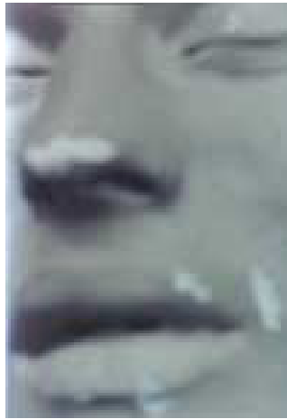
Abbildung 4: 14

Gabriele Leidloff: Untitled, 1997, Fotografie